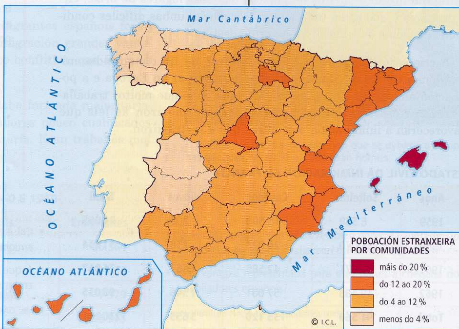
A INMIGRACIÓN EN ESPAÑA EN 2008

A Unión Europea e España levan a cabo un proceso de regulación para controlar a entrada destes inmigrantes, que atopan moitas dificultades e limitacións para obter o permiso de inmigración e de traballo. Iso provoca a entrada clandestina dalgúns deles, coñecidos como sen papeis . Estas persoas poden entrar no país como turistas ou a través das mafias, redes clandestinas de transporte de inmigrantes, coas que contactan para poder realizar o traslado a España. Viaxan en pateras ou caiucos, ou acochados en camiións co risco que iso implica para as súas vidas.