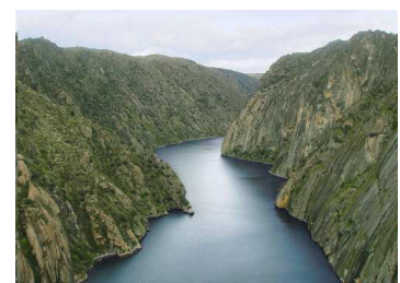
Cañón en el río Duero

Un cañón es un valle fluvial de paredes escarpadas en rocas duras. Si es estrecho se denomina desfiladero, garganta, tajo; cuando describe un arco se le conoce con el nombre de hoz.