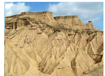
Badlands en el Parque natural de las Bardenas reales (Navarra)

Cañones, cárcavas, barrancos, canales, chimenea de hadas (columnas de roca con formas en sus picos) y otras formas geológicas del estilo son comunes en las tierras baldías. A menudo es difícil caminar por ellas. Normalmente, estas tierras presentan una espectacular gama de color que alterna estrías que van del negro azulado oscuro, característico del carbón, al rojo brillante, característico de la arcilla, la escoria.